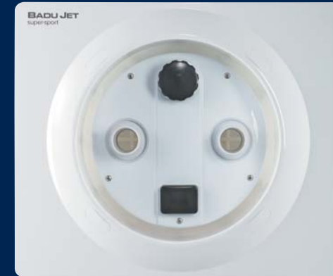
BADU® Jet super-sport

Faites l'expérience d'une nouvelle forme de liberté dans votre propre piscine. Offrez-vous un petit paradis dans votre jardin et jouissez d'une liberté totale sur le plan sportif et de la détente.