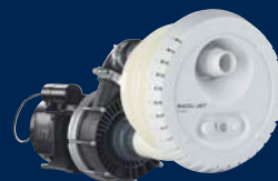
BADU® Jet smart