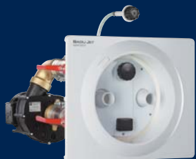
BADU® Jet super-sport