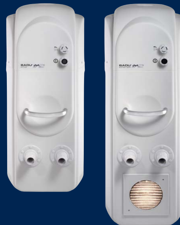
BADU® Jet action V2

La classe « Puissance ». Le BADU® Jet action V2 répond à tous vos souhaits. Les deux buses orientables et à débit réglable défieront une fois de plus n'importe quel bon nageur. Grâce à un projecteur d'une puissance de 300 W, vous pourrez vous entraîner même après le coucher du soleil.