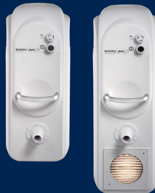
BADU® Jet impulse V2

Le BADU® Jet impulse V2 est également disponible avec un puissant projecteur. Une soirée de détente entre amis en perspective, autour d'une piscine baignée de lumière.