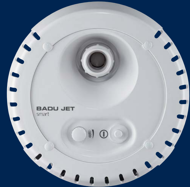
BADU® Jet smart

Grâce à sa conception compacte, le BADU® Jet smart peut être installé dans la quasi totalité des types de piscines. Le montage est très simple et l'appareil requiert très peu d'entretien après son installation.