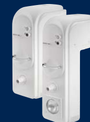
BADU® Jet swing V2