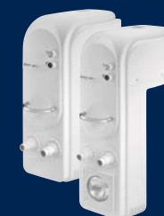
BADU® Jet action V2