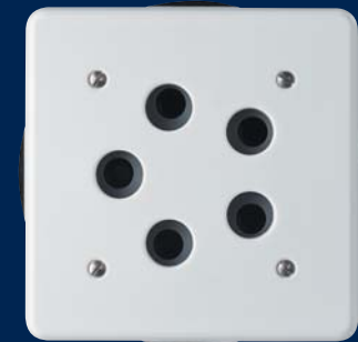
BADU® unités de massage