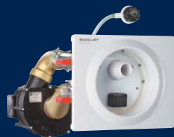
BADU® Jet classic