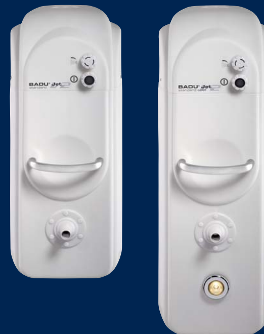
BADU® Jet standard V2

Et, si au cours d'une belle soirée d'été l'envie vous prendait de nager, il suffit d'allumer le projecteur du BADU® Jet standard-spot V2 pour éclairer votre piscine.