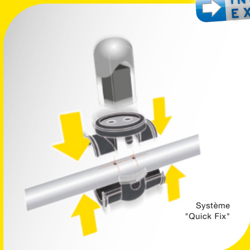
Système "Quick Fix"